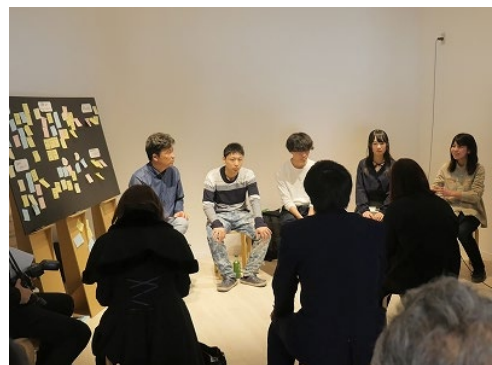
若者トークの様子 (2018/3/28)