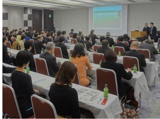
「経団連1%クラブ交流会」講演の様子 (2018/2/26)