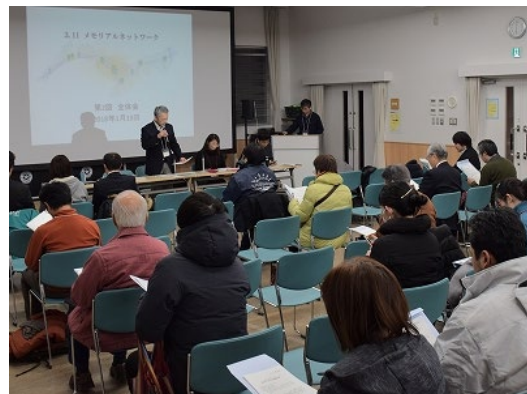
第2回全体会の様子(2018/1/19)